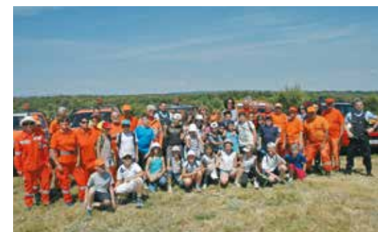
Les CMA et CM2 de l'école Edouard Peisson en visite à la vigie de Ventabren

maintiennent le moral de ces bénévoles qui sont très sollicités pendant la période estivale et toujours mobilisés le reste de l'année.