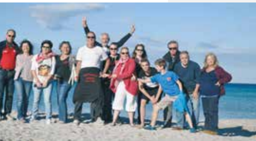
Virée Passion en Corse 2014

Si le cœur vous en dit, venez nous rejoindre au sein d'une équipe passionnée, dynamique et sympathique en adhérant à l'association VRP.