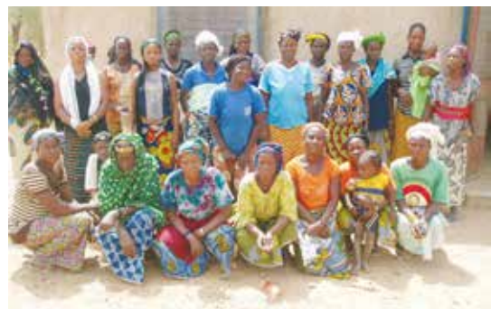
81 femmes ont souscrit un MicroCrédit d'environ 25 000 FCFA (38€).

(cotisation annuelle 40€, déduction fiscale 75%)